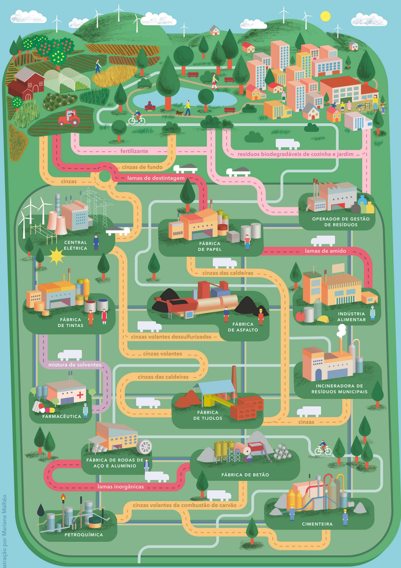
Ilustração por Mariana Malhão